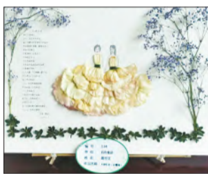
《天使归来》(花瓣画) 黄也文