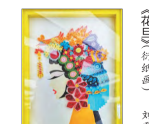
《花好月圆》(衍纸画) 刘露露