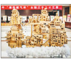
《天空之城》(手工制作) 胡芳