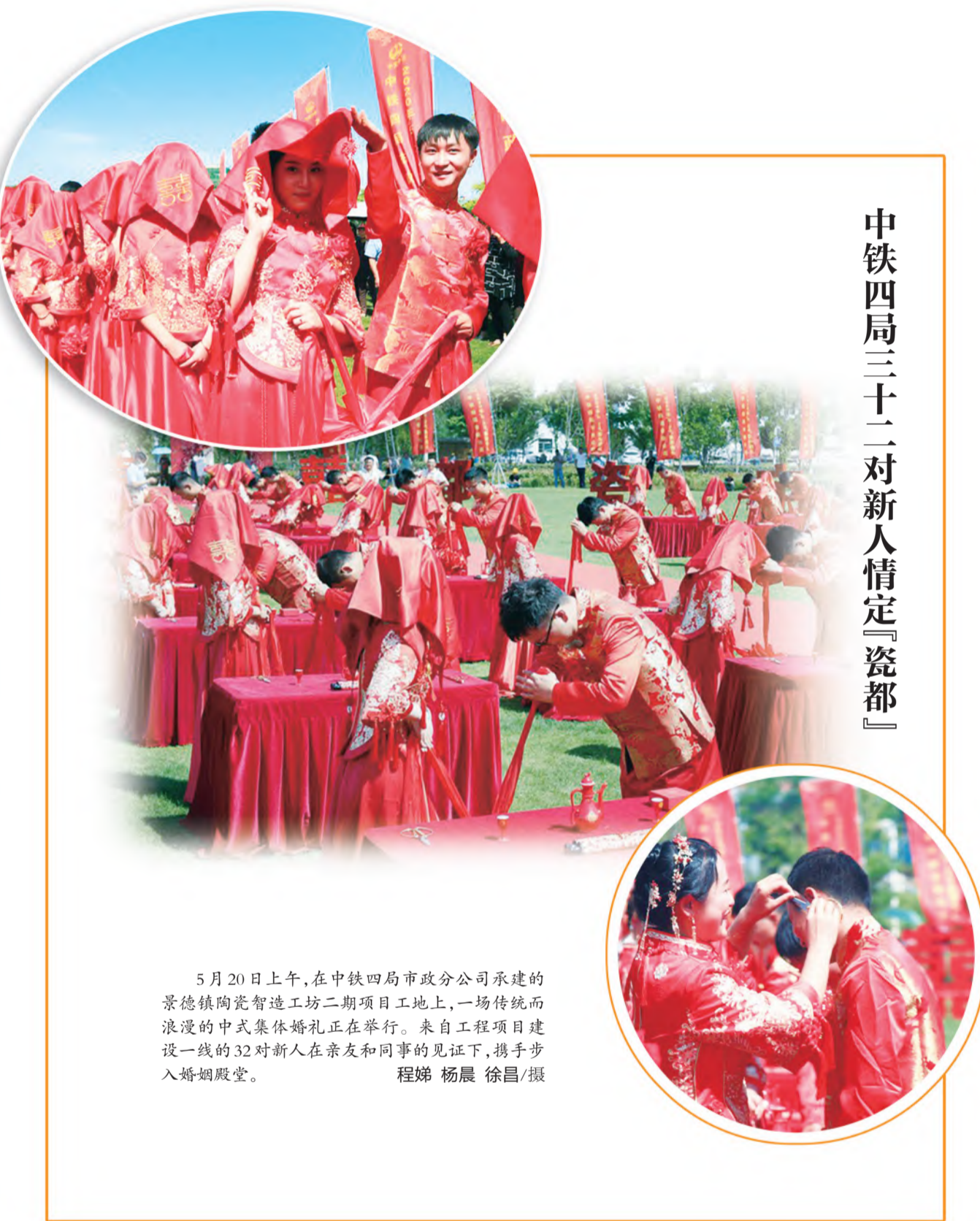
中铁四局三十二对新人情定『瓷都』

终于觅到一个机会，听屯溪吊狮老艺人向笔者揭示了吊狮上杆表演的奥秘，屯溪吊狮艺术，原来是我国传统木偶艺术与屯溪民间艺术相结合的奇葩。正当观众热切观赏时，躲藏在帷幕中的耍狮大师傅，以十倍的紧张，双手并用、十指有序地牵拉或放松着绳索，遥控着杆子上狮子的百般舞姿，决定着吊狮稍纵即逝的时机。妙不可言的是，即使“天机”大露，然而由于耍吊狮大师傅的百般耍技惹人眼花缭乱，因此每逢观赏吊狮时，人们依然百看不厌、乐而忘返。（江志伟）