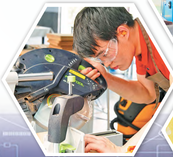
家具制作项目梅子悦