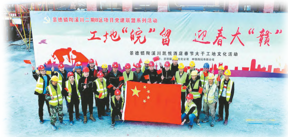
项目工地文化活动