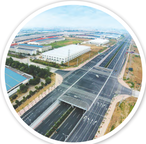
阜阳师范大学信息工程学院新校区建设工程