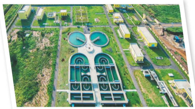
NCC污水处理厂是安哥拉首都第一个现代化污水处理厂