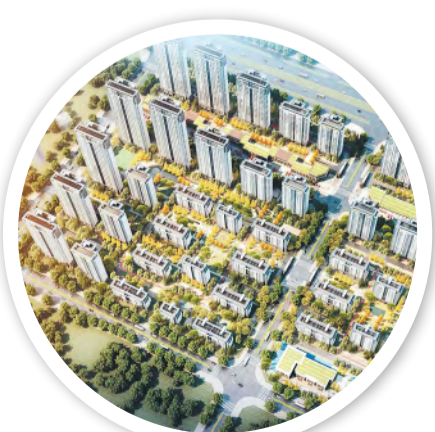
淮南中铁南山名邸二期工程