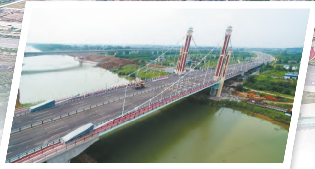
全国首座无上塔柱横梁双塔双跨自锚式悬索桥——阜阳曙光大道泉河大桥