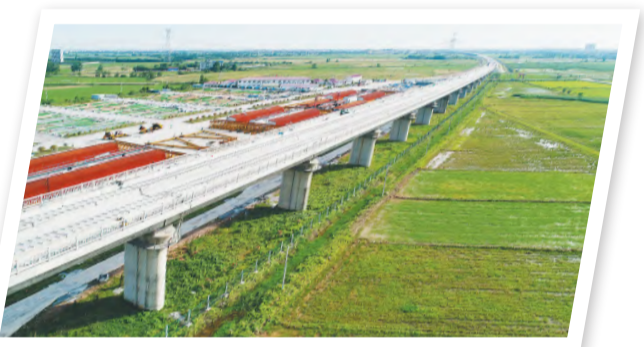
昌吉铁路绿化工程