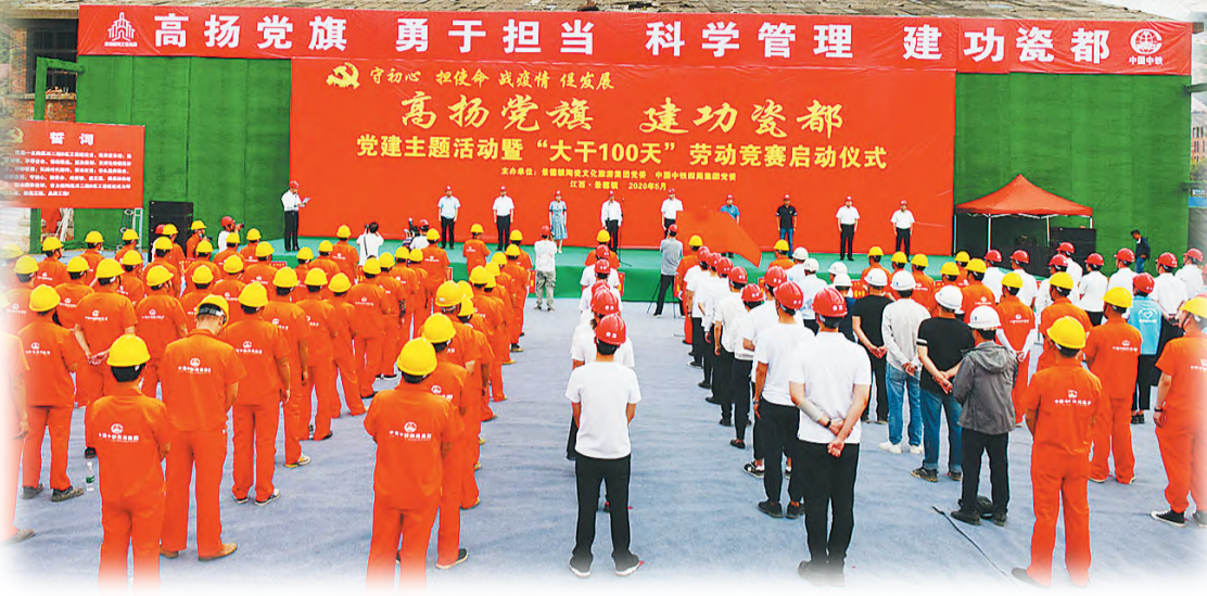
“高扬党旗 建功瓷都”党建主题活动暨“大干100天”劳动竞赛启动仪式