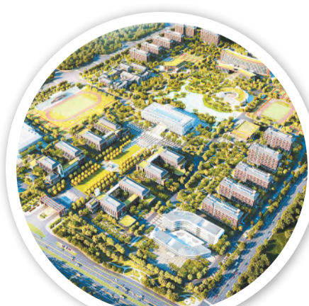
合肥市方兴大道工程获中国中铁优质工程奖