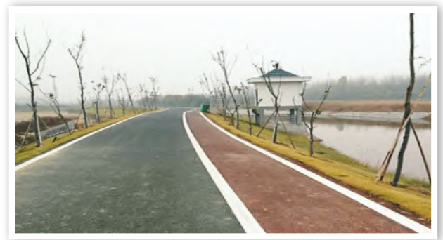
公司承建的河道整治及堤顶道路工程

安全是施工企业的生命线。在安全管理工作中,公司长期奉行“安全文化贯彻于生产,生产依托于安全文化”的安全发展理念,大力强化企业安全文化建设,从安全基础工作入手,完善安全生产基础管理制度和考核办法,进一步落实安全生产责任制,一级抓一级,一级对一级负责,目标明确。同时还采取各种有效措施,对职工广泛进行安全生产的宣传培训教育,着力提高全员的安全意识,使全公司的安全工作为现场施工生产保驾护航,有效地遏制了各种事故的发生,为公司平稳较快发展营造了良好的环境。2019年,公司获得安徽省水利安全标准化二级单位、合肥市安全文化建设示范企业荣誉称号。