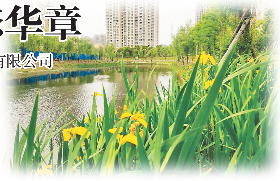
公司承建的龙腾路明渠水生态修复工程

极引进高校应届毕业生。在加大专业人才储备力度的同时,还通过猎头公司招聘生态修复、园林景观、电子与智能化、苗木销售、贸易和农林产业的高端人才。同时加大了分配制度改革力度,建立了以市场为导向的薪酬管理机制。全员绩效与公司目标挂钩管理,在收入上重点向技术研发、设计、项目一线岗位倾斜。坚持“以人为本”的工作理念,注重员工的培养与提高,畅通人才晋升渠道,完善人才选拔机制,搭建人尽其才、才尽其用的人才成长环境,进一步畅通优秀年轻干部成长渠道,拓宽了成长空间。此外,还大力宣扬劳模精神、工匠精神,通过加大对先进生产者、季度之星等先进典型的宣传表彰,激发员工的荣誉感和责任感,提升企业凝聚力和向心力。