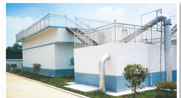
公司承建的农村饮水安全工程

他是这么说的也是这么做的。在企业发展壮大的同时,他始终不忘回馈社会,热心公益事业,情牵弱势群体。公司将农民工工资的规