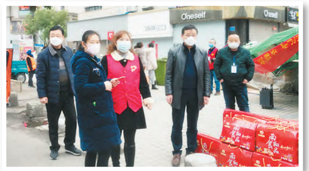
向社区捐赠防疫物资和资金

巢湖市水利建设有限公司成立于2001年,为巢湖市国有企业改制而成的股份制企业,现有在册职工70人。公司主项资质为水利水电工程施工总承包二级,增项资质为河湖整治工程专业承包、水利水电设备安装工程专业承包、市政公用工程施工总承包资质。拥有多名高、中级水利专业技术人才和一级、二级建造师,是一支施工能力强、专业水准高、整体素质硬的水利队伍。公司拥有中小型机械设备近百台套,具有较强的机械施工和市场竞争力。多年来,公司秉承“诚实、信用、优质、高效”的经营理念,不断加强内部管理、转换经营格局、充分挖掘潜力,全方位服务社会,一年一个大发展、一年上一