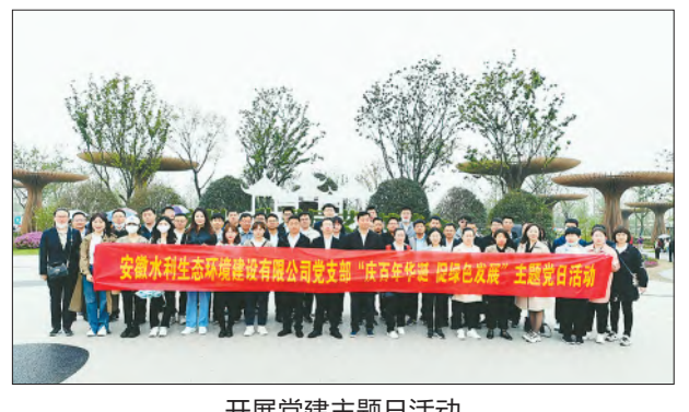
开展党建主题活动

踏遍青山人未老,风景这边独好。站在“两个一百年”奋斗目标的历史交汇点,安徽水利生态环境建设有限公司将以更加饱满的热情、更加高昂的斗志、更加优异的成绩,践行初心使命,恪守责任担当,奋力开启“十四五”高质量发展的新篇章。(李劲松 薛典春)