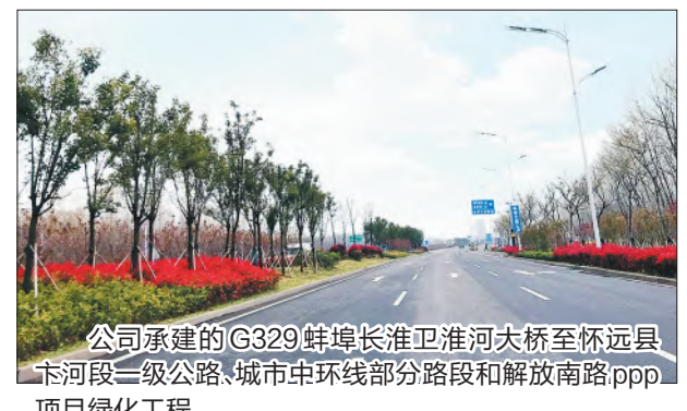
公司承建的G329蚌埠淮淮淮河大桥至怀远县卞河段一级公路、城市中环线部分路段和解放南路PPP项目绿化工程