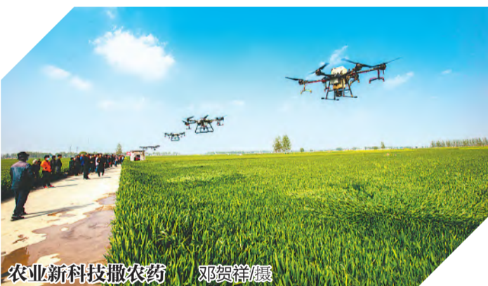
农业新技术撒农药

所建设、队伍组建、活动开展、工作保障等作出具体安排，建成一批乡村“复兴少年宫”并投入使用；2021年10月以后，乡村“复兴少年宫”正式开放，面向少年儿童组织开展活动；2022年5月至6月，对试点地方的工作进行调研评估、总结经验做法，鼓励全省各地积极探索各具特色、富有成效的建设路径和模式，为全面铺开乡村“复兴少年宫”建设打下良好基础。（邵磊）