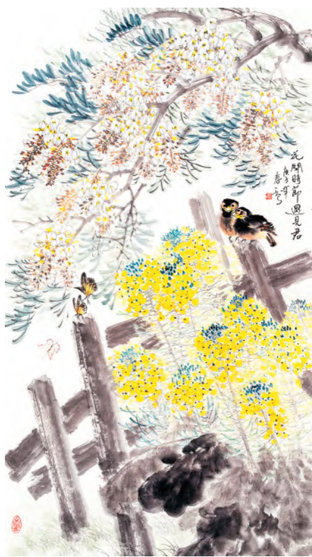
《花开时节遇见君》(国画) 卞燕/作