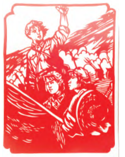
《向前,向前!》(剪纸) 葛侯君作