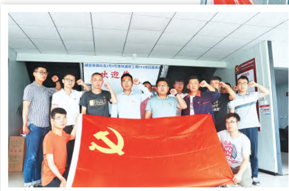
开展“我和党旗合影”活动

为积极贯彻落实安徽交航公司党委关于开展党史学习教育的工作方案精神,项目党支部加强组织领导,结合工作实际,以新时代文明实践点为载体之一,认真组织研究部署,以强有力举措,有序推进项目党支部党史学习教育扎实开展。坚持做到学史明理、学史增信、学史崇德、学史力行,在学习中国共产党百年辉煌历史中激发斗志,增强业务本领,提升攻坚克难的能力水平,不断推动项目部各项工作。