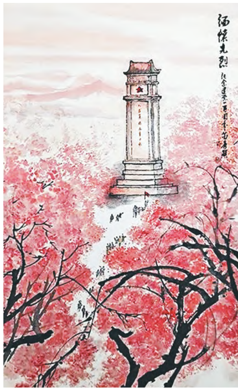
《缅怀先烈》(国画) 苗秀颖/作