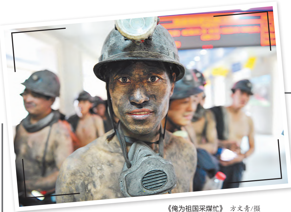
《俺为祖国采煤忙》