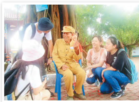
《听爷爷讲革命故事》