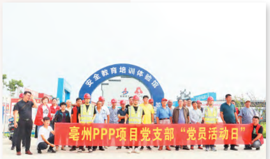
安全体验主题党日

把正方向则无往不胜。项目部先后获评市级建筑安全生产标准化示范工地,安徽建工集团“党员先锋号”“青年文明号”,安徽交航“战疫情、抢工期、保目标、促超产”劳动竞赛第三名、“先进基层党组织”“优秀项目部”等一系列荣誉。 最美丽的风景是“文明”。安徽交航亳州市中心城区铁路以东2号3号地块道排工程PPP项目自创建新时代文明实践点以来,在上级党委领导下,项目部着力把新时代文明实践点建设成传播党的声音、传承优秀文化、培育文明新风等多功能的综合性宣传教育平台,打造成离职工群众最近、职工群众最喜爱的学习活动阵地,极大地满足了广大工友、属地群众、企业职工的精神文化生活,促进了项目的高质量建设,走出了一条有特色、有亮点、质量优的新时代文明实践之路,树立了安徽交航优质品牌形象,为打造一流安徽建工贡献了力量。(陆忠军 典春 劲松)