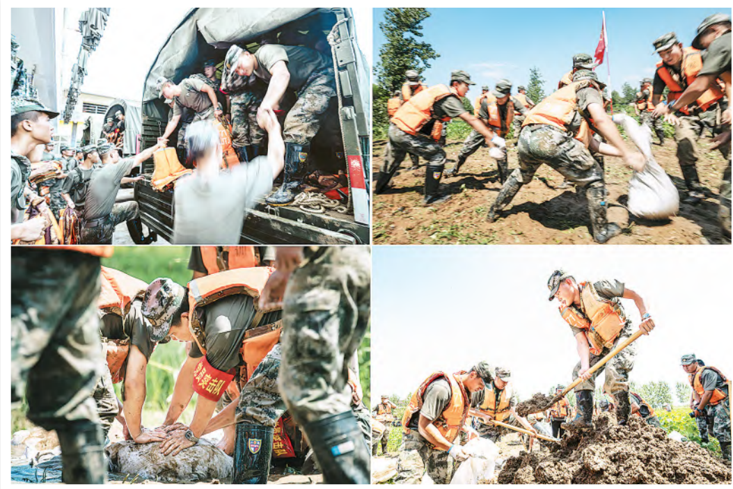
《钢铁长城》