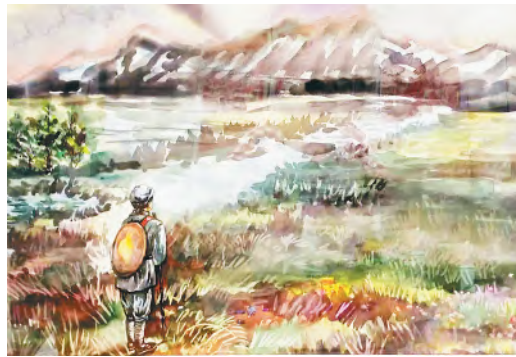
《红色足迹》(水彩) 刘春燕/作