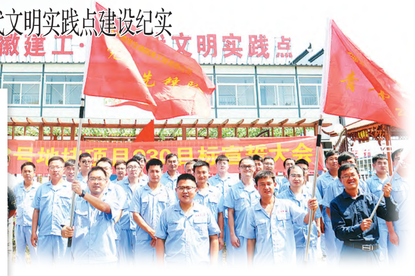
在新时代文明实践点举行劳动竞赛宣誓活动

展丰富多样的志愿服务活动。志愿者服务队为职工、农民工及社区群众开展义务理发、义诊、节日问候等服务活动,为农民工及社区老人、困难群众等群体“送关爱、送温暖、送服务、送健康、送安全”。通过开展各类特色志愿服务活动将新时代文明实践点打造成项目部联系群众、引导群众、凝聚群众、服务群众的特色阵地,让项目部职工、农民工及社区群众真正从“文明实践”中得到实实在在的参与感、获得感和认同感。