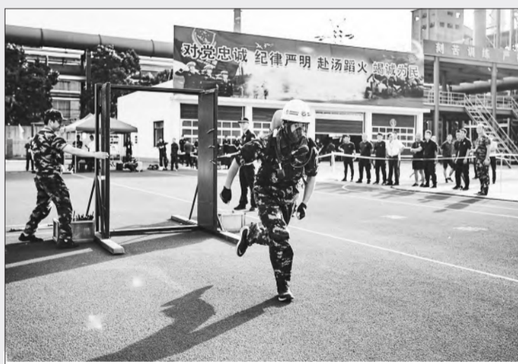
9月24日，安徽省第四届危险化学品救援技术竞赛在马鞍山市拉开帷幕，来自全省的马钢(集团)、临涣焦化公司等10支队伍60余名队员同台竞技。项目涉及理论知识、综合体能、单兵抢险救援、带压快速堵漏、化工装置初期火灾处置、危化救援综合操等。