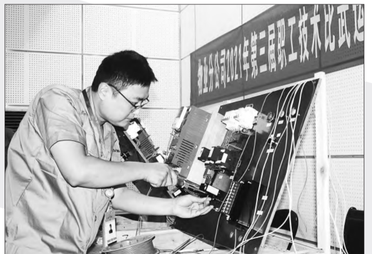
9月22日，淮北矿业集团物业分公司职工正在参加变频控制组装置技术比武。当天，该公司2021年度职工技术比武运动会正式开赛，157名职工参加了焊作业、保洁服务、驾驶员业务等10个项目的技能比武。