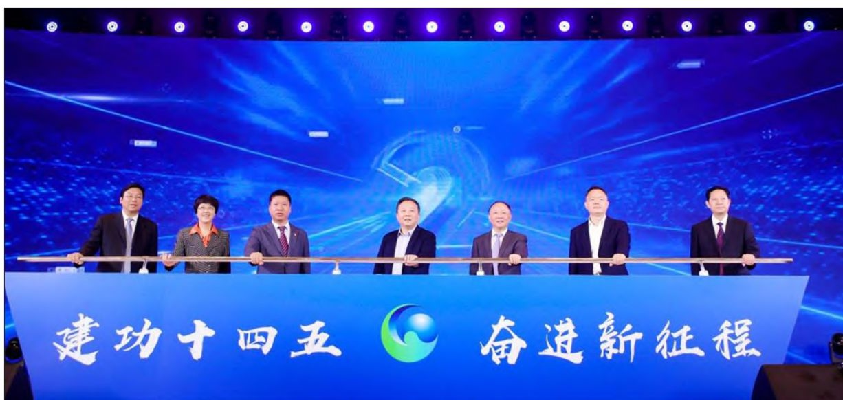
宋国权等领导出席大赛启动仪式