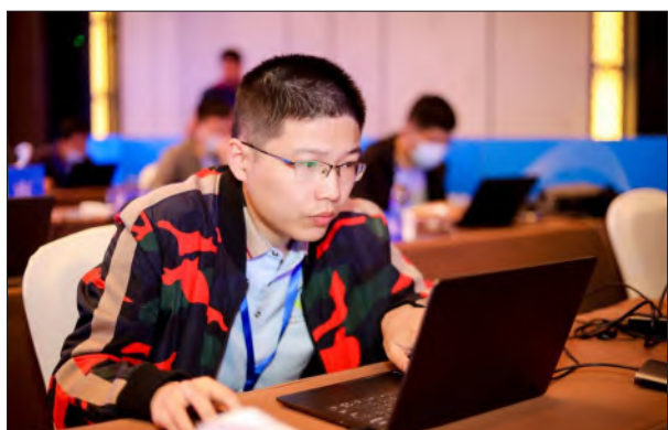
选手正在进行比赛