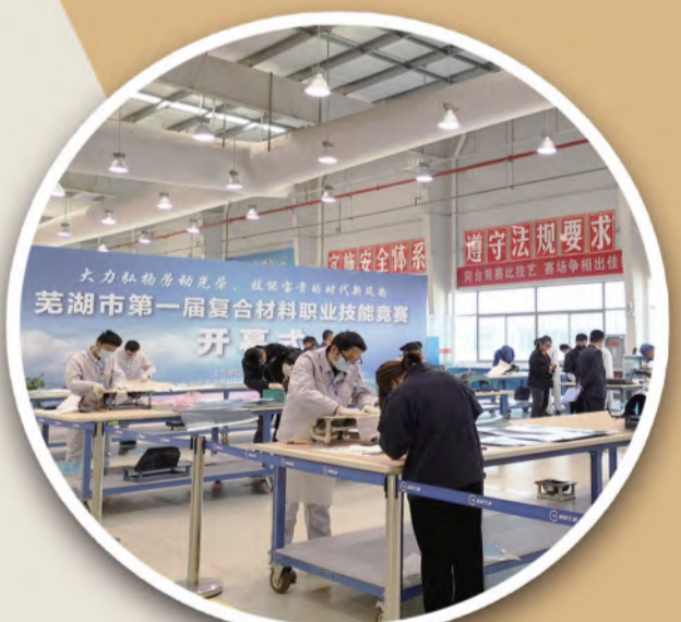
举办全市职工职业技能竞赛