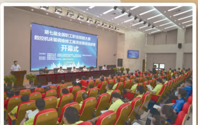
第七届全国职工职业技能大赛数控机床装调维修赛项安徽省选拔赛在芜湖举办