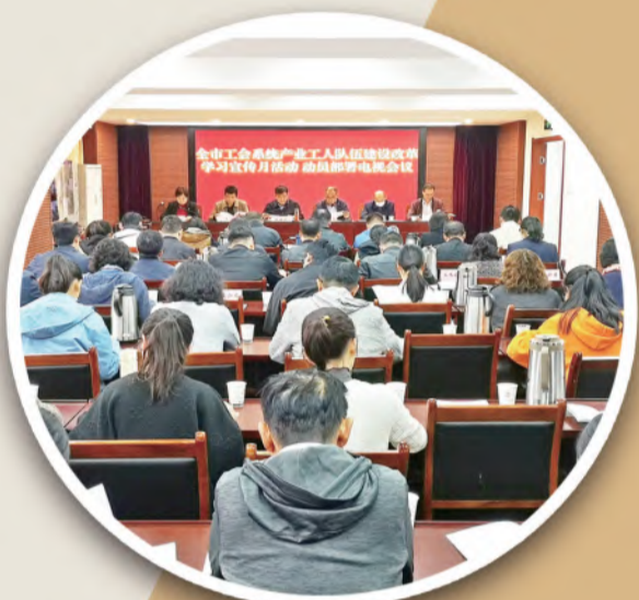
开展产业工人队伍建设改革学习宣传月活动

成立芜湖市产业工人队伍思想政治研究中心;在7个单位开展新时代职工文明实践中心建设试点;建立芜湖职业教育联盟,联合职业院校、企业、行业协会开展合作交流,促进合作办学和资源共享;推进芜湖四大支柱产业劳模工匠创新工作室联盟建设;成立“芜湖市劳动争议联合调解中心”,形成劳动争议调、裁、诉“一站式”维权服务新模式;运用智慧工会平台促进产业工人队伍建设……芜湖市在推进新时代产业工人队伍建设改革中采取的一系列有效举措,走出了一条具有芜湖特色的产业工人队伍建设改革路子。