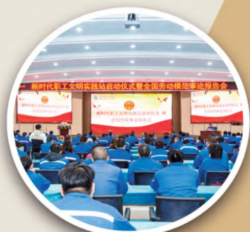
芜湖新兴铸管有限责任公司新时代职工文明实践站启动仪式