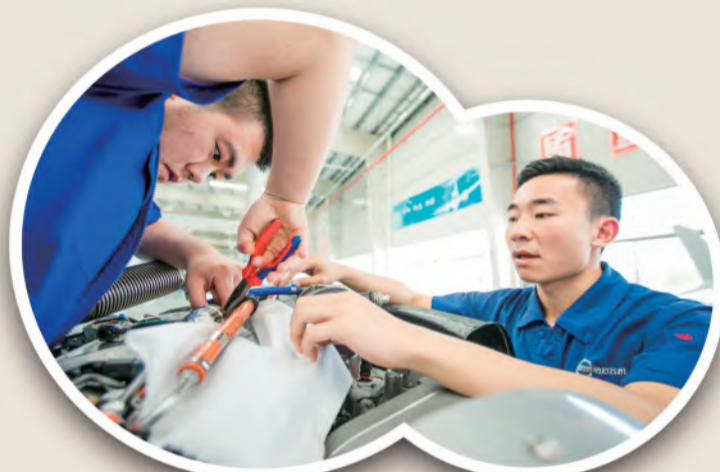
中电科芜湖钻石飞机制造有限公司创新“师徒带”技能人才培养模式

加快职业教育资源整合,实现优势互补,实行“大兵团协同作战”是芜湖市在推进“产改”过程中的又一