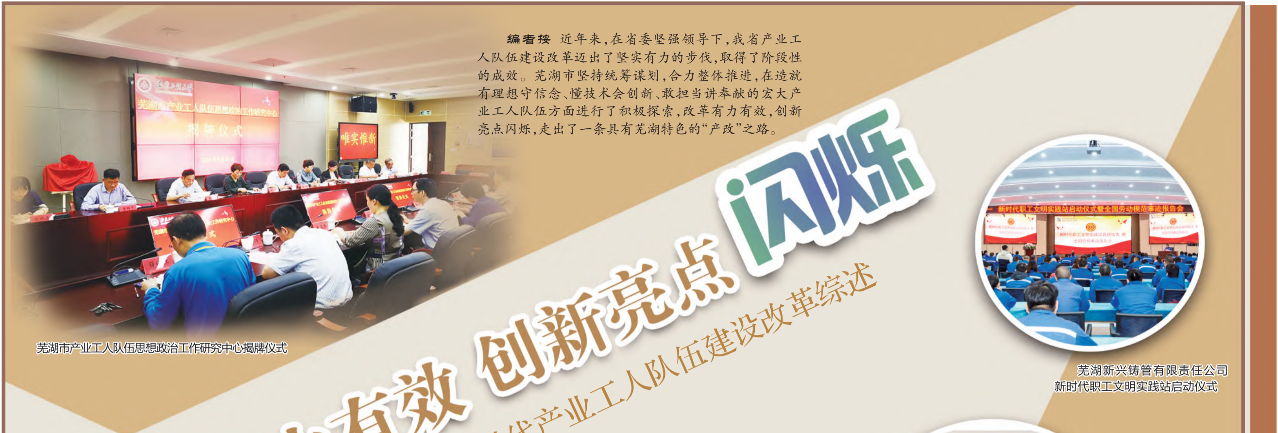
芜湖市产业工人队伍思想政治研究中心揭牌仪式

编者按 近年来,在省委坚强领导下,我省产业工人队伍建设改革迈出了坚实有力的步伐,取得了阶段性的成效。芜湖市坚持统筹谋划,合力整体推进,在造就有理想守信念、懂技术会创新、敢担当讲奉献的宏大产业工人队伍方面进行了积极探索,改革有力有效,创新亮点闪烁,走出了一条具有芜湖特色的“产改”之路。