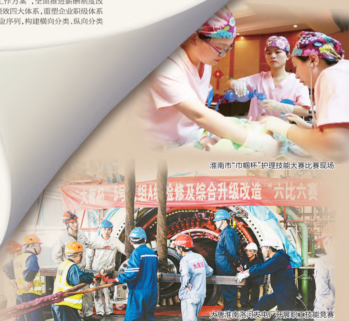
淮南市“巾帼杯”护理技能大赛比赛现场

下一步,淮南市总工会将坚持“改革、创新、发展”一条主线,聚焦“学习宣传贯彻党的十九届六中全会精神及中央经济工作会议精神”两大方面,深入推进“产业工人队伍建设改革”“服务职工创新创业”“普惠服务职工共享”“强基固本创新发展”四大行动,推动淮南工会工作不断开创新局面。(淮工)