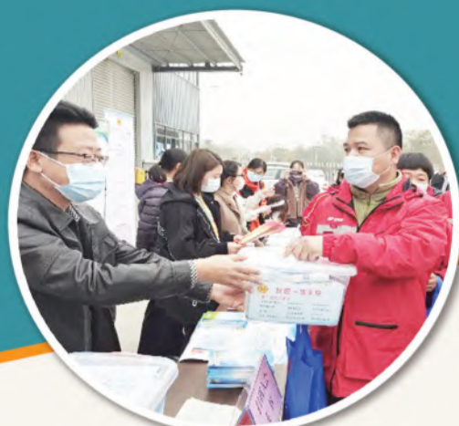
新就业形态劳动者扫码入会,现场发放爱心大礼包

去岁欣欣硕果,新年跃跃绘宏图。回首2021,一个个难忘的瞬间拼凑出淮南工会奋斗的身影。 这一年,淮南市总工会深化群众性竞赛活动,开展劳动竞赛1649场次,参赛职工36.6万人次,在省职工安全健康技能大赛(线上)活动中,职工参加数位列地市组第一,获省总工会通报表扬。 这一年,淮南市总工会依托文化宫及培训学校完善校企合作订单式培养和联合培养育人模式,实施就业技能及提升培训10万人次。 …… 这一年,淮南市各级工会围绕省总工会工作部署,落实“42101”重点工作和三项改革工作任务,工会工作彰显新特色,取得新成效。