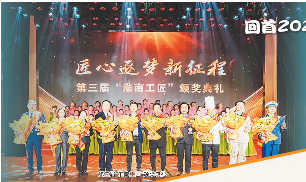
第三届“淮南工匠”颁奖典礼