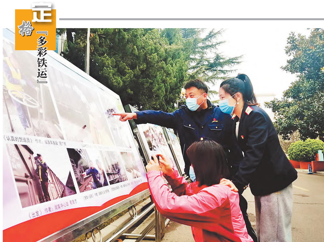
淮北矿业集团铁运处工会为展现职工爱岗敬业的风采,3月18日,对“多彩铁运”职工摄影展中征集的200多张照片进行了择优展出。职工们用独特的视角,将职工在一线奋斗的身影定格成多彩的光影瞬间。图为该处职工在欣赏展出的作品。