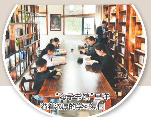
“海子书馆”里洋溢着浓厚的学习氛围

而每到春暖花开时节,查湾村都要组织开展“春暖花开看查湾”的文化之旅,吸引更多外地游客前来读诗、赏景、观展、拍摄,体验书香文化和田园之美。(檀志扬)