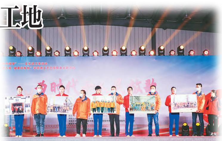
赠送《建设者身影》作品

活动期间,志愿者为铜陵市一线摄影、书法工作者及爱好者进行了创作辅导、作品点评,开展了“建设者身影”宣传拍摄活动等,并向G3铜陵长江公铁大桥工程项目部赠送了摄影、书法和剪纸作品。(张扬)