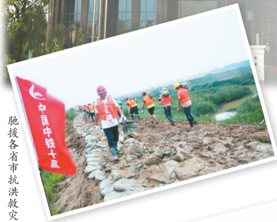
驰援各省市抗洪救灾