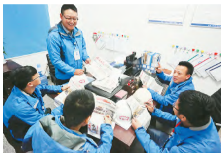
开展系列教育活动