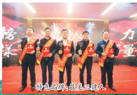
特色品牌:最美三建人