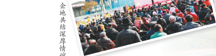
企地共结深厚情谊

11月20日,全国精神文明建设表彰大会在北京举行。中铁十局集团第三建设有限公司(以下简称三建公司)被中央精神文明建设指导委员会授予“第六届全国文明单位”荣誉称号,标志着该公司精神文明建设再上新台阶。