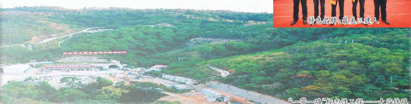
“一带一路”标志性工程——大临铁路

汉高祖十一年七月,淮南王英布反,刘邦亲征,激战于会甄,并于次年十月击溃英布。这里所说的会甄即为现在的宿州市埇桥区大营镇。