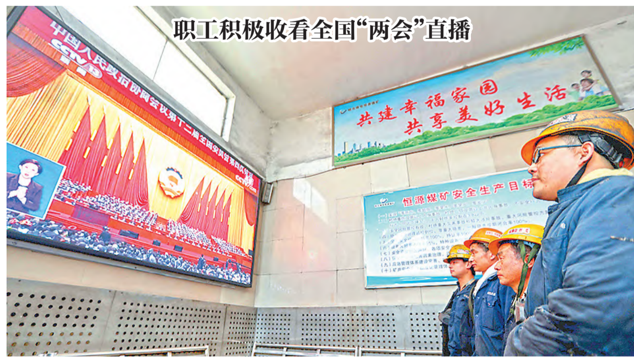
职工积极收看全国“两会”直播

“磨刀石”、作为深化宗旨意识的“检验尺”、作为激励担当实干的“动力源”,切实增强政治自觉思想自觉行动自觉。要牢牢把握“学史明理、学史增信、学史崇德、学史力行”目标要求,突出抓好党史学习教育重点内容,努力在“学党史”中开阔视野格局,在“悟思想”中坚定理想信念,在“办实事”中厚植为民情怀,在“开新局”中锤炼过硬本领,切实以学习教育实效推动新时代安徽工会工作创新发展。