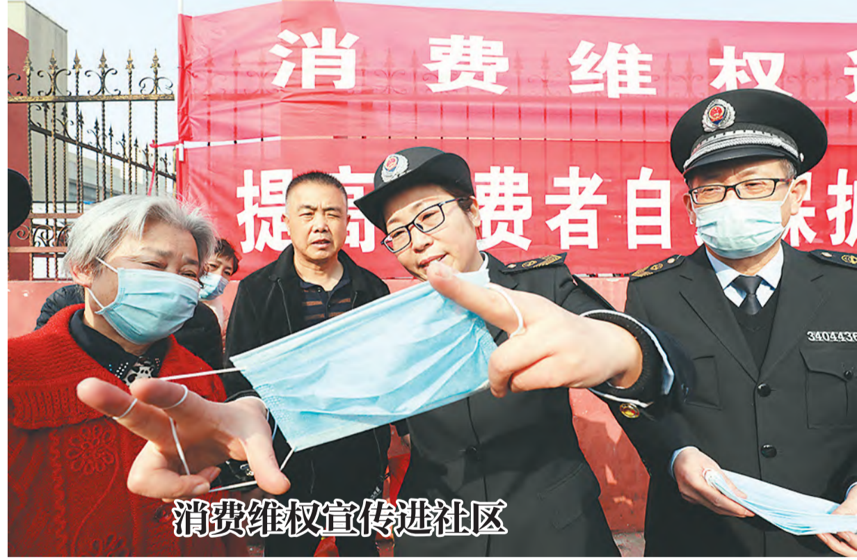
消费维权宣传进社区

2021年,铁运处把提升企业形象作为“五大任务”之一,结合此次调研成果,制定改造方案,把改善民生工作与生产经营工作同布置、同检查、同考核,确保今年10月份各项工程如期完工,真正把“民生清单”变成实实在在的“幸福账单”。 (张艳)