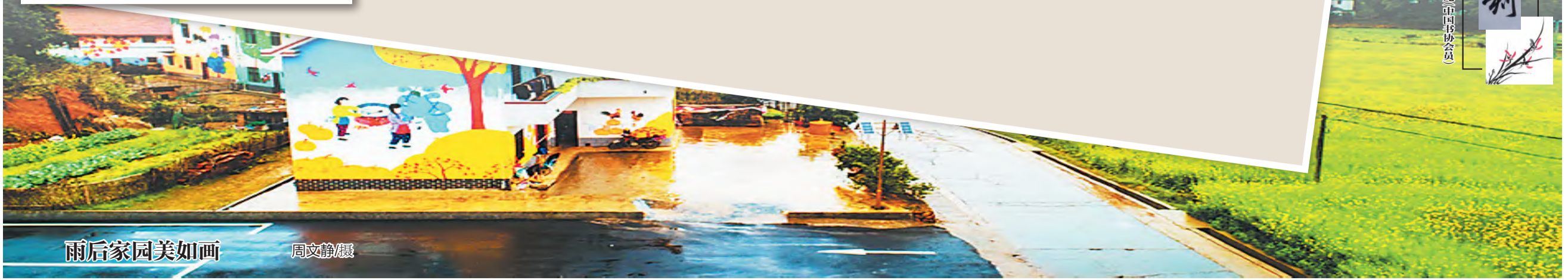
雨后家园美如画